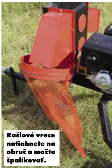
Rašlové vrece natiahnute na obruč a možte špalikovať.