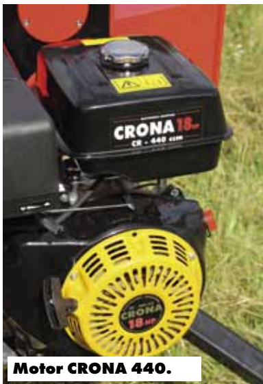
Motor CRONA 440.

Predvedenie výroby je na profi úrovni, na materiály sa nešetří, všetko je skôr predimenzované, čo sa prejaví na životnosti stroja.